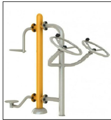
Twister+koła tai chi