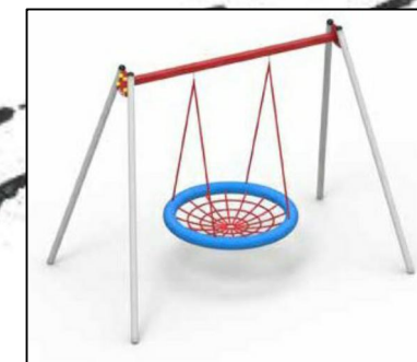
Huśtawka bocianie gniazdo