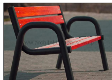
kosz na śmieci i ławka parkowa