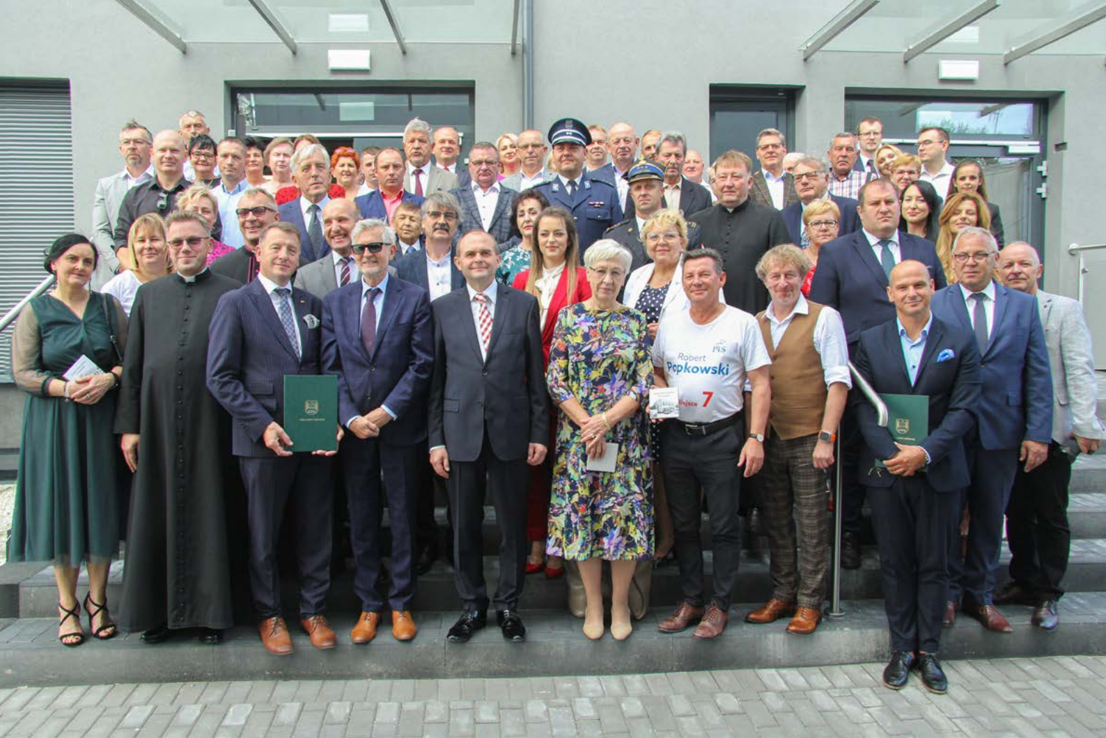
I Oficjalne otwarcie Domu Kultury w Kościelecu.