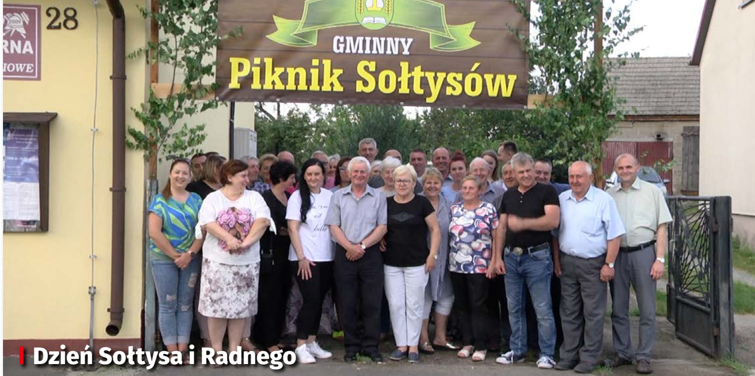
| Dzień Sołtysa i Radnego