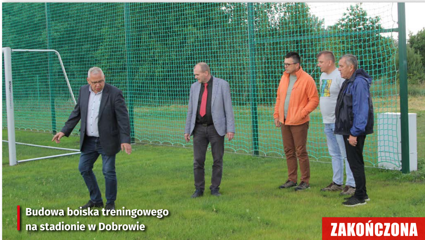
Budowa boiska treningowego na stadionie w Dobrowie