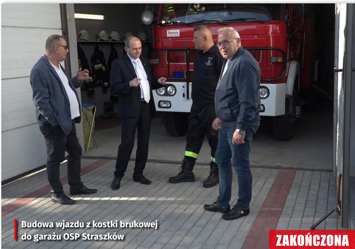
Budowa wjazdu z kostki brukowej do garażu OSP Straszków