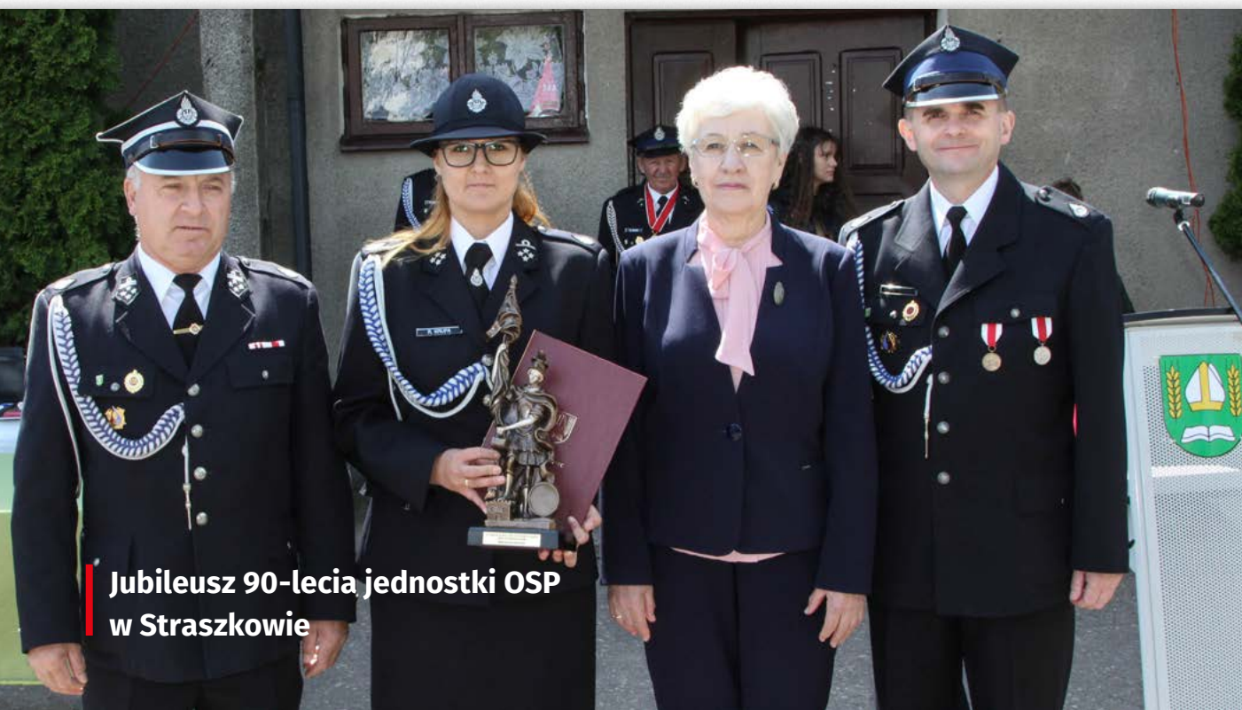
Jubileusz 90-lecia jednostki OSP w Straszkwie