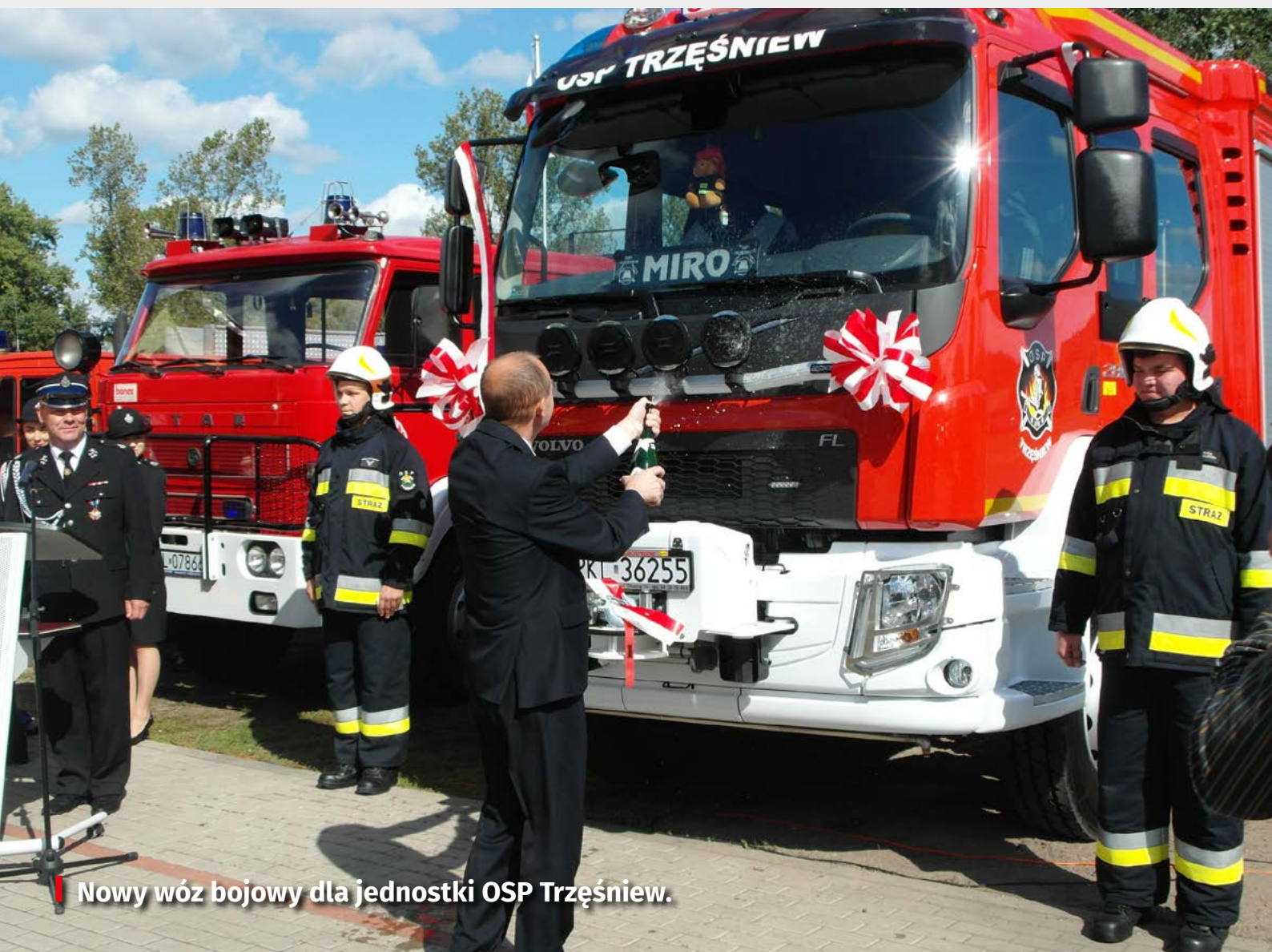
Nowy wóz bojowy dla jednostki OSP Trzęsniew.