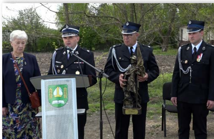
Jubileusz 100-lecia jednostki OSP w Białkowie Kościelnym