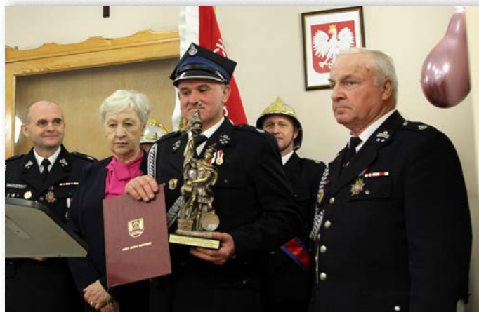
Jubileusz 75-lecia jednostki OSP w Turach