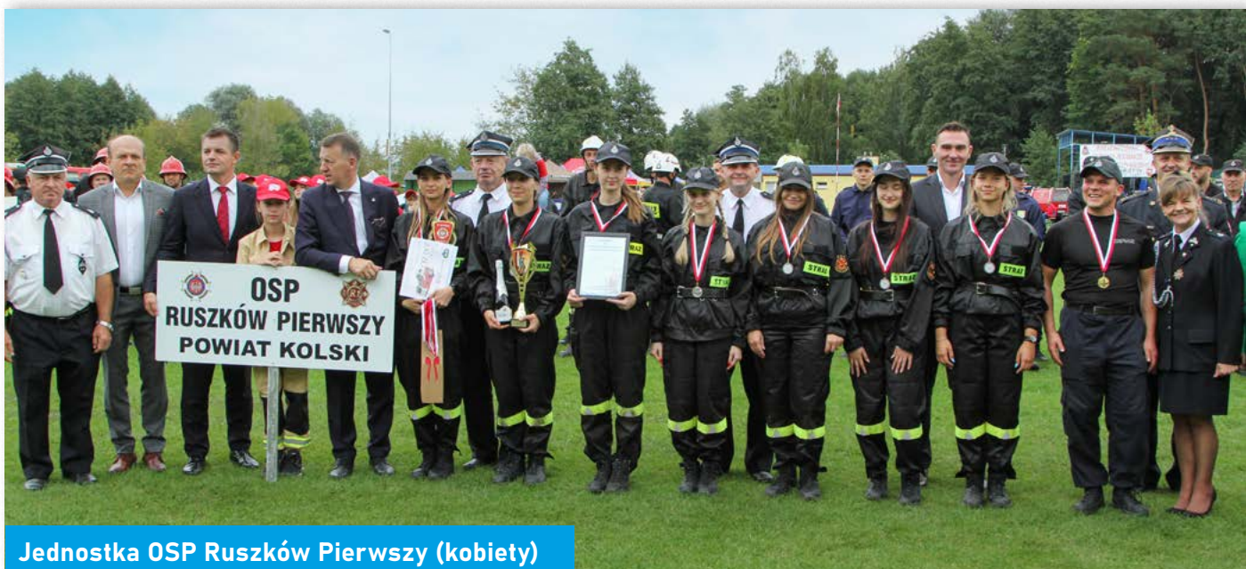
Jednostka OSP Ruszków Pierwszy (kobiety)