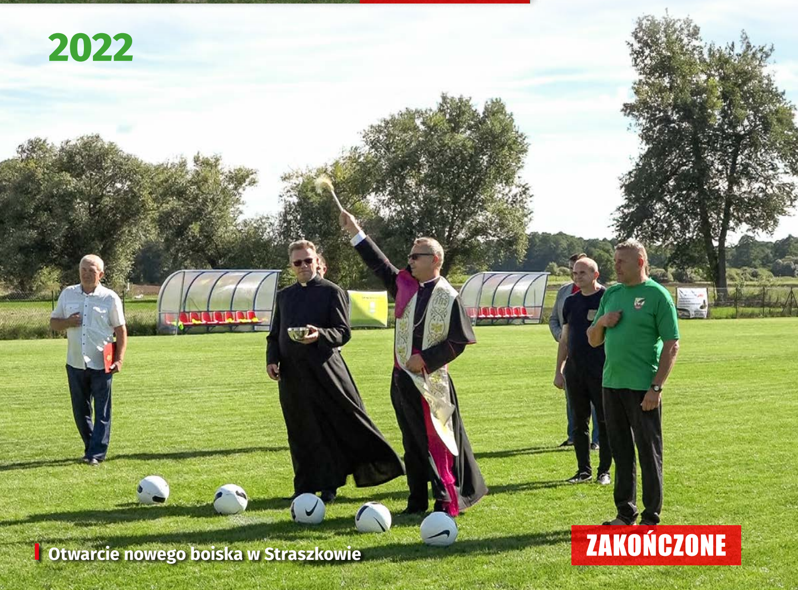
Otwarcie nowego boiska w Straszkwie