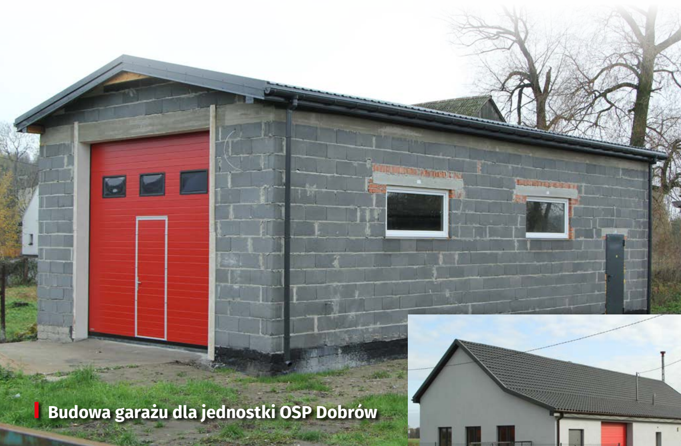
Budowa garażu dla jednostki OSP Dobrów