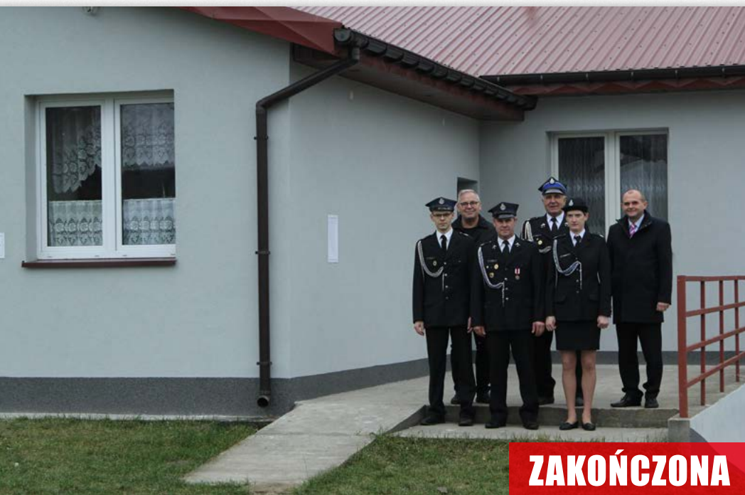
Nowa elewacja budynku remizy OSP w Gąsiorowie