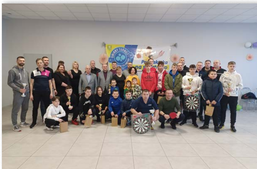
Gminny Turniej Tenisa Stołowego w Ruszkowie Pierwszym