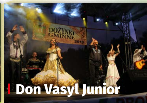
I Don Vasył Junior