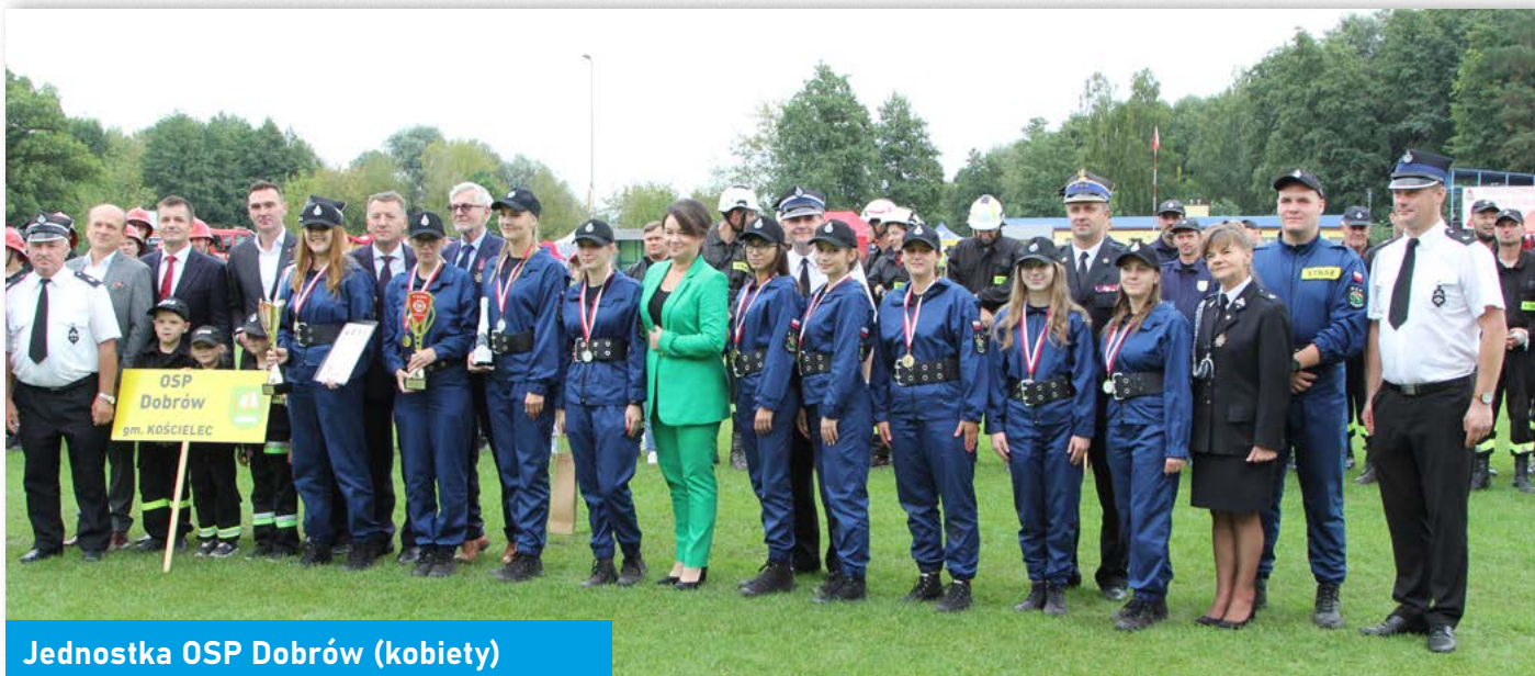
Jednostka OSP Dobrów (kobiety)