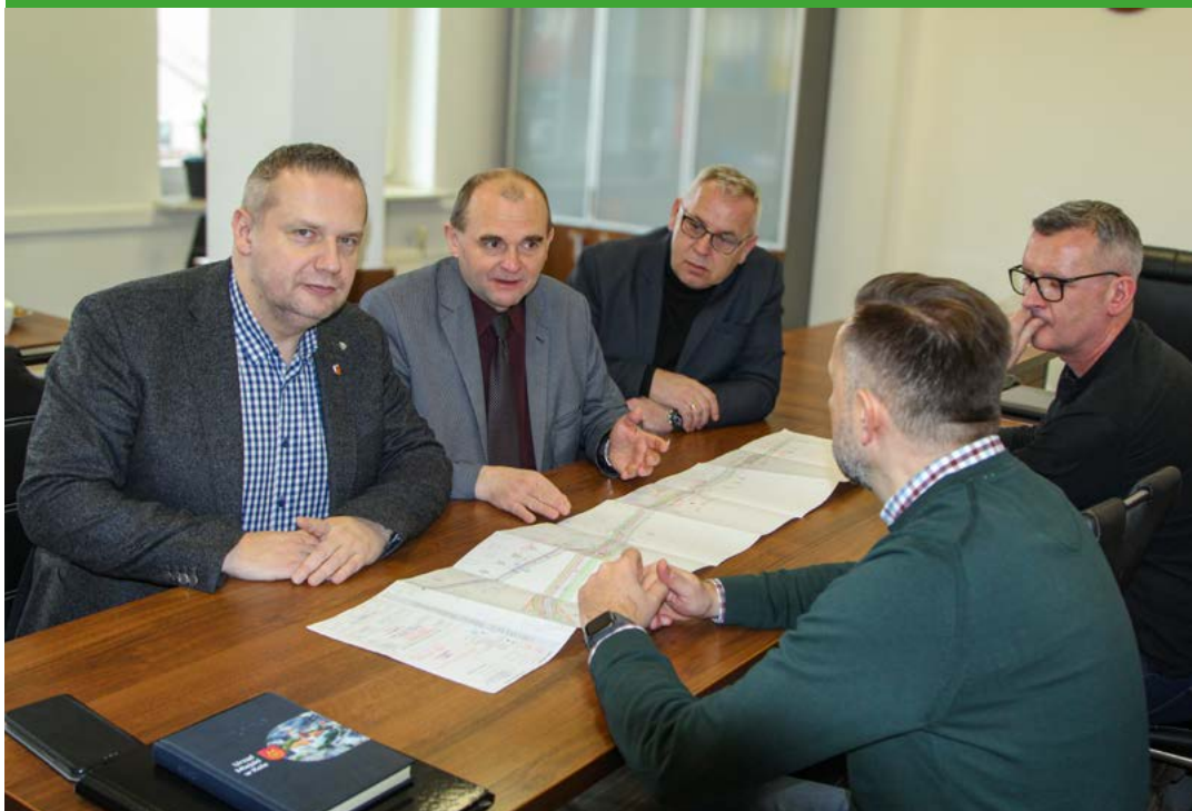
| Spotkanie poświęcone budowie ulicy Kazimierza Wielkiego, wspólnej inwestycji z Miastem Kołem