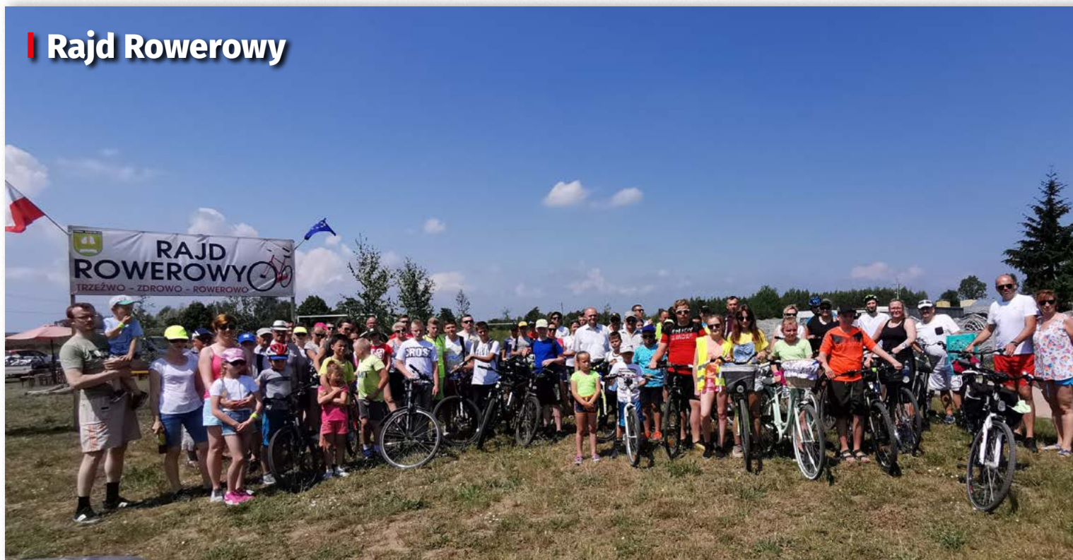
| Rajd Rowerowy