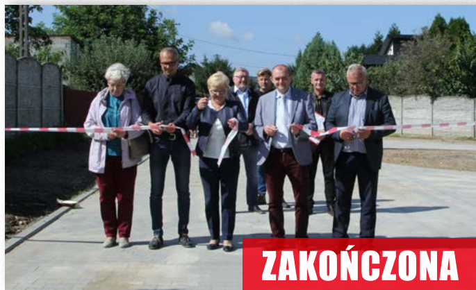
Przebudowa drogi w miejscowości Leszcze