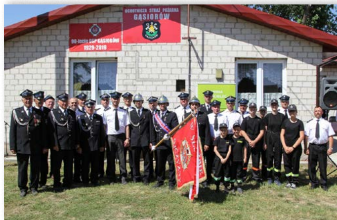
Jubileusz 90-lecia jednostki OSP w Gąsiorowie