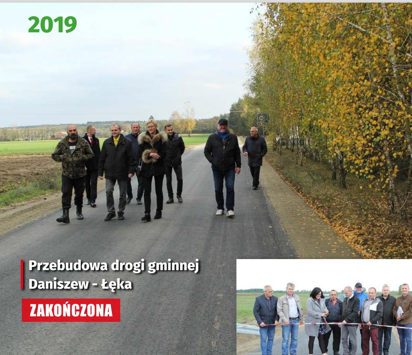
Przebudowa drogi gminnej Daniszew - Łęka