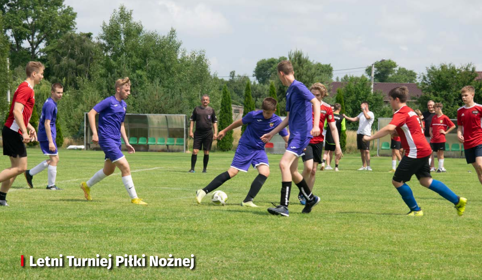
Letni Turniej Piłki Nożnej