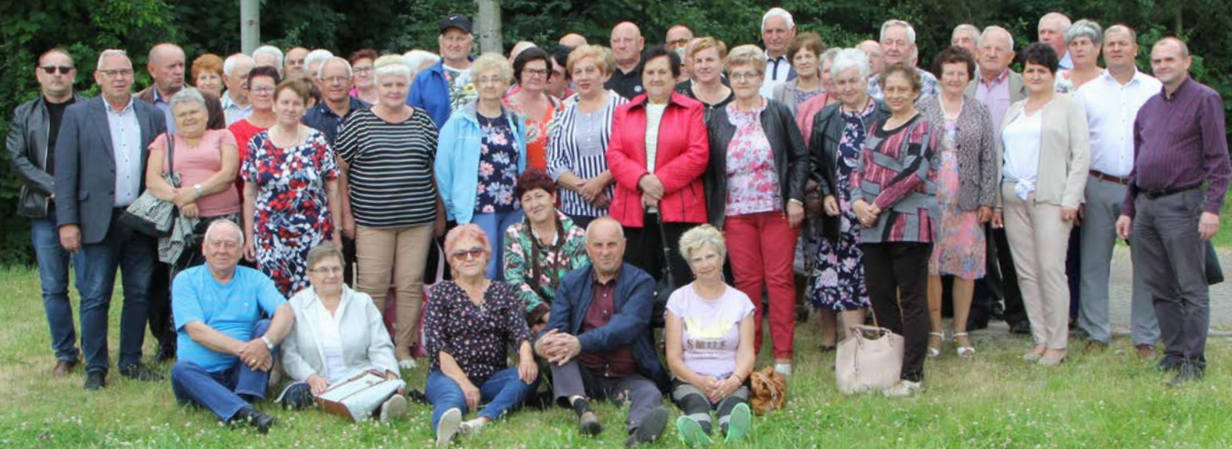
Dzień sportu seniora