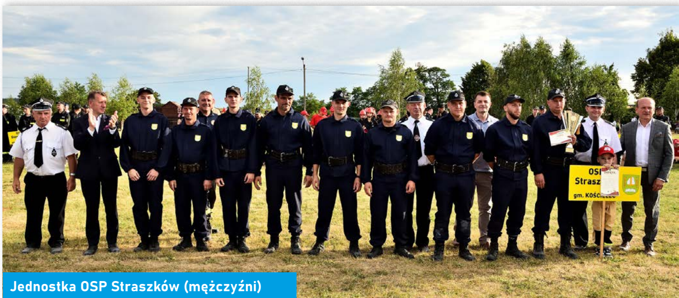
Jednostka OSP Straszów (mężczyźni)