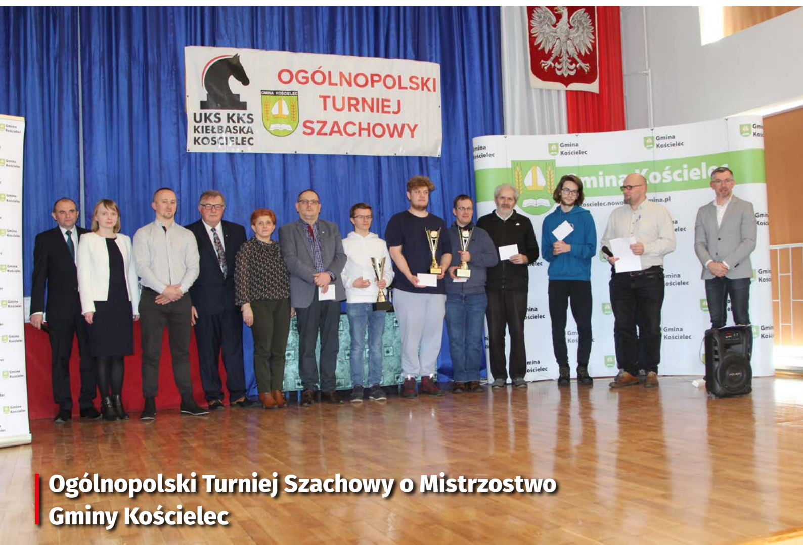
Ogólnopolski Turniej Szachowy o Mistrzostwo Gminy Kościelec