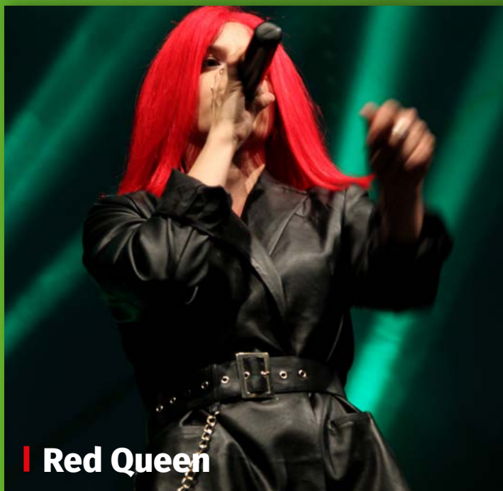
| Red Queen