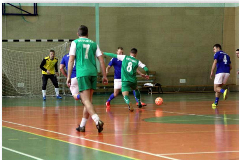
Halowy Turniej Piłki Nożnej