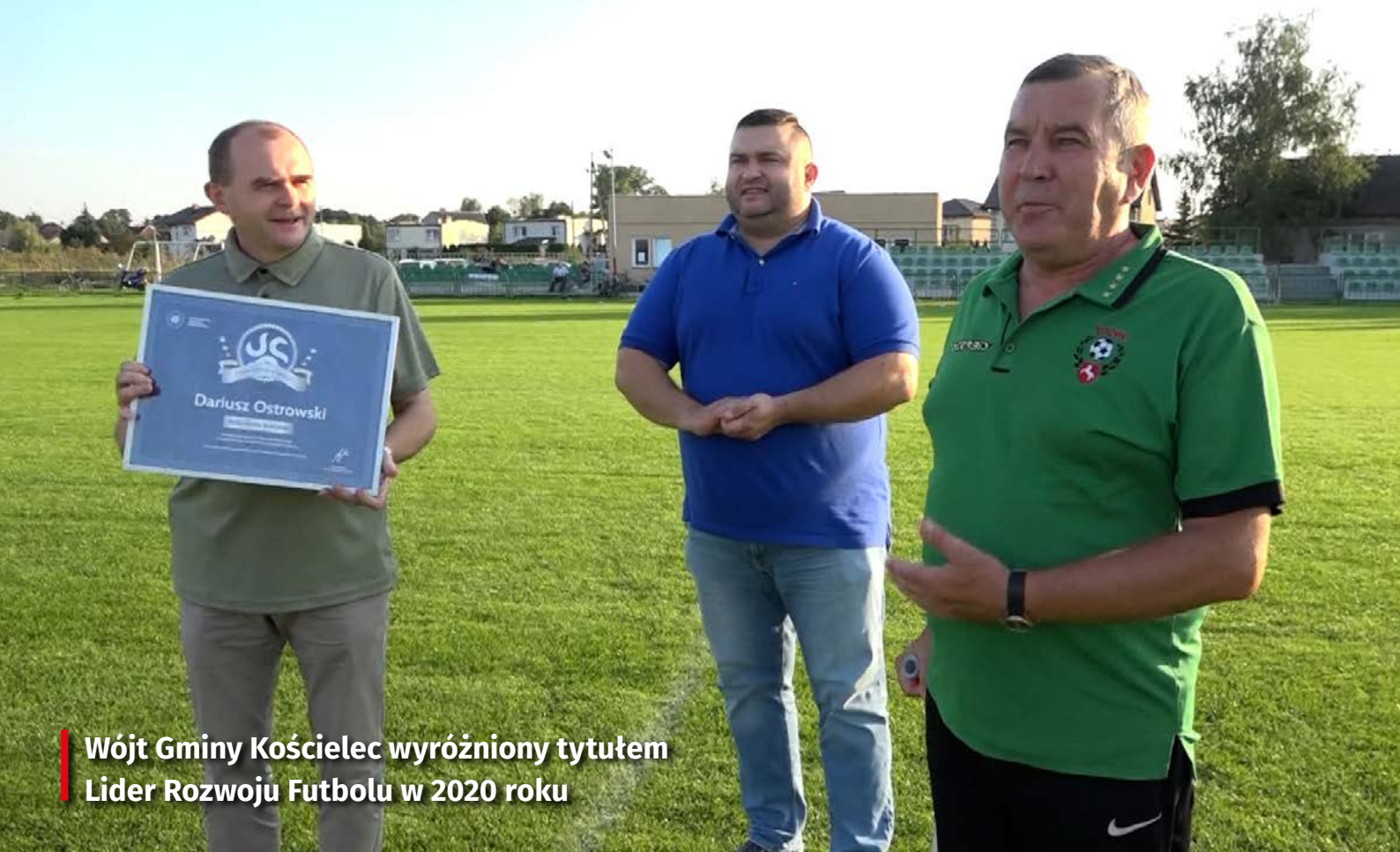
Wójt Gminy Kościelec wyróżniony tytułem Lider Rozwoju Futbolu w 2020 roku