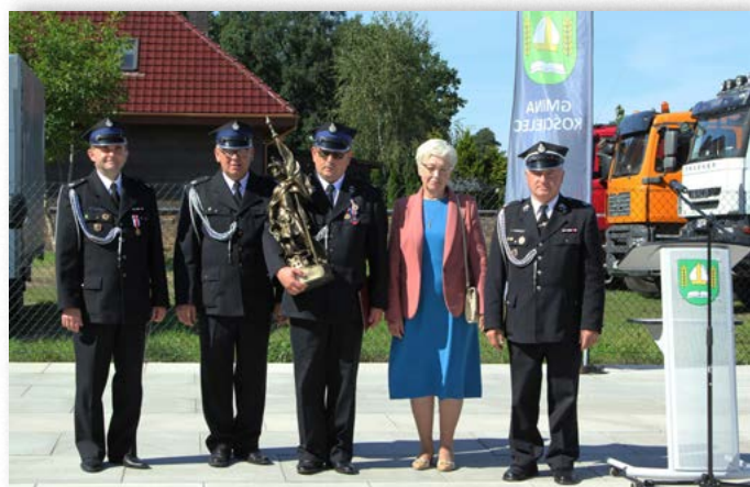
Jubileusz 75-lecia jednostki OSP w Policach Średnich