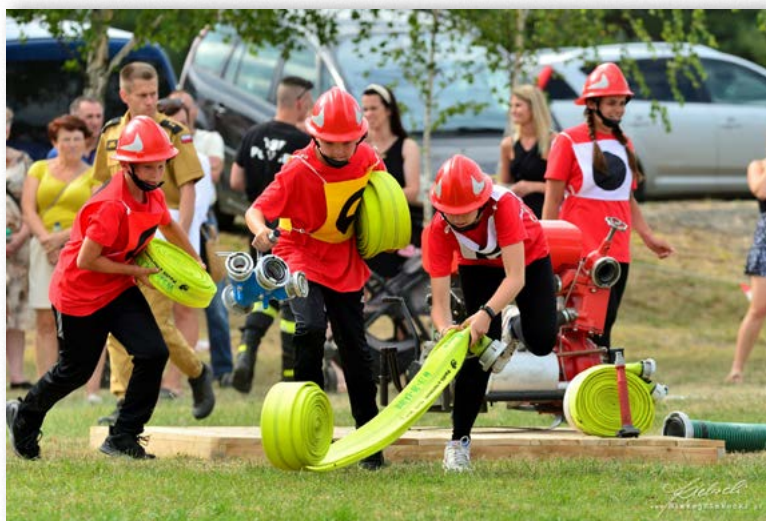
| Gminne Zawody Sportowo - Pożarnicze