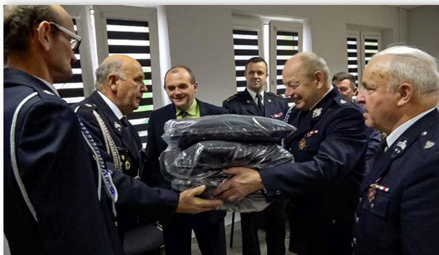
Przekazanie kurtek wyjściowych dla druhów ufundowanych przez Wójta Gminy Kościelec.